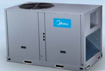
پکیج سرمایشی پشت بامی