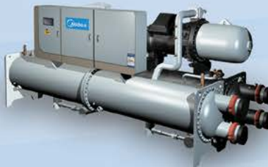
چیلر اسکرو آب خنک