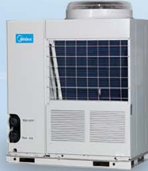
چیلر اسکرال ماژولار هوا خنک