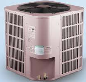
داکت اسپلیت (بالازن | کنارزن)