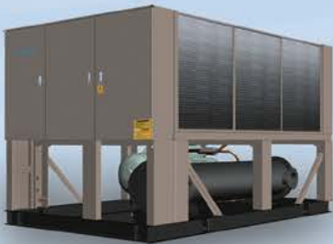
چیلر اسکرو هوا خنک