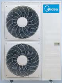
مینی چیلر هوا خنک اینورتر